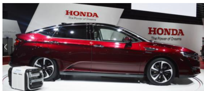
Honda Clarity Fuel Cell és az előtérben, balra a külső adapter.

A fenti hírhez kapcsolódik, hogy október végén, a 2015-ös Tokyo Motor Show keretei között mutatták be a Honda új hidrogén tüzelőanyag-cellás (HTC) modelljét, Honda Clarity Fuel Cell néven. A Honda 2016 márciusában bocsátja a japán piacra ezt a modellt. A Toyotához, pontosabban a Toyota már piacon lévő HTC modelljéhez képest annyiban eltérő üzleti modell szerint, hogy kezdetben lízing konstrukcióban kínálják, az első évben pedig nem magánszemélyeknek, hanem céges vagy önkormányzati autóflokkok részeként.