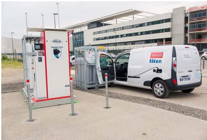
Egy vállalati flottába tartozó Renault Kangoo ZE-H2 hidrogénnel történő tankolása.

egyik legnagyobb elektromos járműflottáját üzemelteti. Ezres nagyságrendben használnak elektromos Renault Kangoo Z.E. járműveket. Nem meglepő, hogy az adott járműtípussal már igen számottevő tapasztalattal rendelkező cég az egyik „legjobb otthona” (korai alkalmazója) lesz a Kangoo Z.E továbbfejlesztett, még funkcionálisabb tüzelőanyag-cellás változatának.