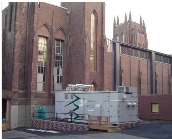
DFC300 tüzelőanyag-cellás kiserőmű New Havenben, a Yale egyetem udvarán.

A FuelCell Energy ügyvezetője kiemelte: „ez a projekt olyan modellként is szolgálhat, amely könnyen multiplikálható lesz más városokban, államokban is. Ebben az üzemeltetői és tulajdonosi