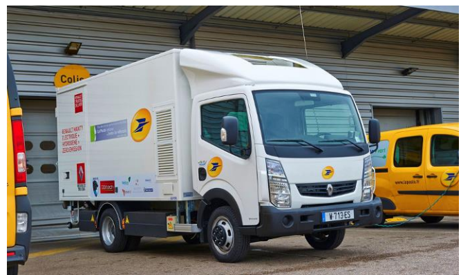
Renault Maxity Electric tüzelőanyag-cellás hatótávnövelővel, tesztüzemben a francia postánál.

Megjegyezendő, hogy a Renault és a Symbio FuelCell együttműködés eredményeként nem csak a fent említett kishaszonjármű érhető el, hanem egy nagyobb, 4,5 tonnás Renault Maxity Electric nevű elektromos kisteherautó is, amely szintén hidrogén tüzelőanyag-cellás hatótávnövelővel van felszerelve. Ebben a modellben 20 kW-os a tüzelőanyag-cellás egység (4 kg, 350 bar-on tárolt hidrogén), és 42 kWh-s akkumulátor található, amelyek együtt mintegy 200 km-es hatótávot biztosítanak. Aszinkron villanymotorjának teljesítménye 47 kW, forgatónyomatéka 270 Nm. Ez a modell még nem terjedt el, próbaüzeme jelenleg van folyamatban a La Poste-nál (lásd a lenti képen).