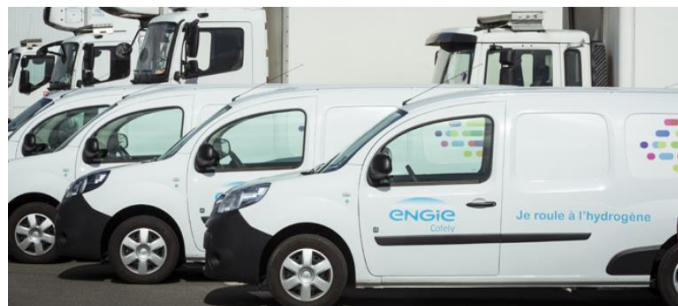
A Renault Kangoo ZE H2 flotta (egy része).

A Franciaországból érkező hírek között meg kell még említenünk, hogy az ENGIE nemrég üzembe állította az ország eddigi legnagyobb, hidrogén üzemű járművekből álló céges flottáját. Pontosabban 50 darab Renault Kangoo ZE H2 járműről van szó, amelyekben viszonylag kis teljesítményű tüzelőanyag-cella található, aminek a hatótáv növelése a feladata. Az ún. range extendernek köszönhetően nagyjából megduplázható a hagyományos, tisztán akkumulátoros Renault Kangoo hatótávja. A jármű így kb 400 km-t tehet meg. A kocsikat az ENGIE Cofely cég technikusai használják normál szolgálati autóként Ile-de-France körzetében, azaz a párizsi régióban, amihez az említett hatótáv bőségesen elegendő. A range extender funkció miatt a flotta kiszolgálására egy viszonylag kicsi, 80 kg/nap kapacitású hidrogén töltőállomás is elegendő, de a jármű akkumulátora hálózatról is tölthető (plug-in).