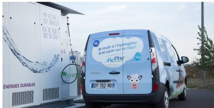
Tüzelőanyag-cella range extender-rel rendelkező Renault Kangoo ZE H2 tankolása hidrogénnel.

A fentiekhez szorosan kapcsolódó nyári hír, hogy a francia EDF (Electricité de France) 16 millió eurós befektetéssel a szintén francia hidrogén-specialista McPhy legnagyobb részvényesévé (21,7%) lépett elő, míg a cég irányításának szavazati jogában 20,4%-ot mondhat magáénak. A McPhy a hidrogén előállítás, tárolás és egyes hidrogén-technológiák (pl. pl. elektrolizálók) gyártásában jelentős szereplő: tevékenysége a K+F fázistól, a tervezésen és gyártáson át, az üzemeltetésig tartó folyamatokat egyaránt átfogja. Franciaország jelenlegi mintegy 20 hidrogén töltőállomásából 13-at ez a cég szállította le. A tranzakcióval javult a McPhy nemzetközi növekedési esélye. Az EDF számára az az előny, hogy az áramszolgáltató közvetlenül „belép” a fent említett,