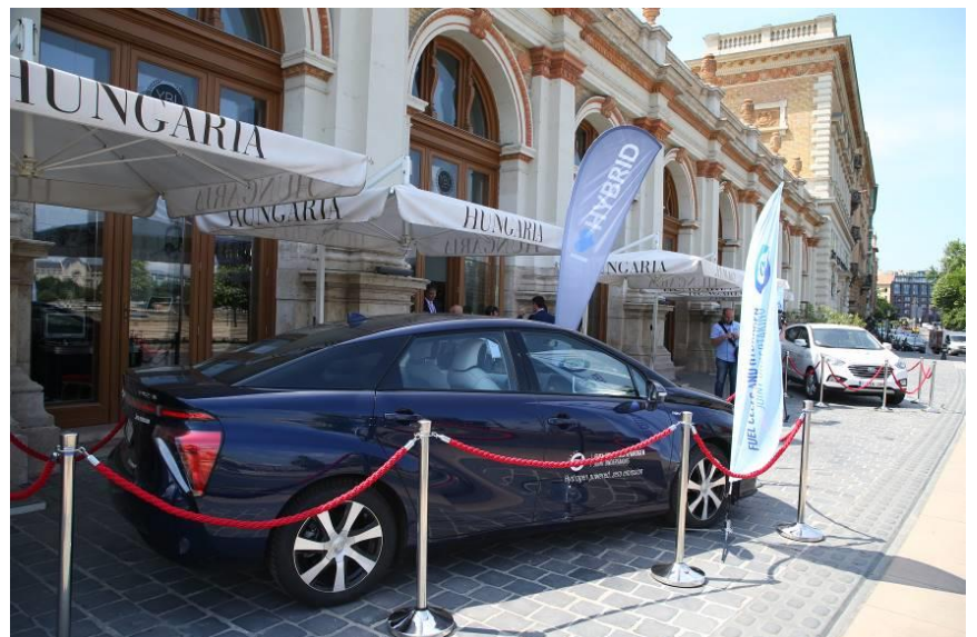
Hidrogén üzemű autók a Várkert Bazár soron, 2018.05.23.

Az EU legjelentősebb hidrogén és hidrogén-technológiai szervezete, a Hydrogen & Fuel Cells Joint Undertaking (FCH-JU) 2018-ban ünnepli fennállásának 10. évfordulóját. Ez alkalomból az FCH-JU - kifejezetten Közép- és Kelet-Európára fókuszálva – május 28-án Szófiában rendezte meg nemzetközi hidrogén-technológia konferenciáját. Ennek egyfajta felvezető eseményeként az FCH-JU két, saját hidrogén tüzelőanyag-cellás autóját – egy Hyundai ix35 Fuel Cellt és egy Toyota Mirait – Budapestre és Szófiába is elhozta egy-egy szakmai bemutatóra. A budapesti hidrogén autó bemutatót és workshopot az FCH-JU mellett, magyarországi partnerként a Magyar Hidrogén és Tüzelőanyag-cella Egyesület szervezte, együttműködésben az MTA Természettudományi Kutatóközponttal.